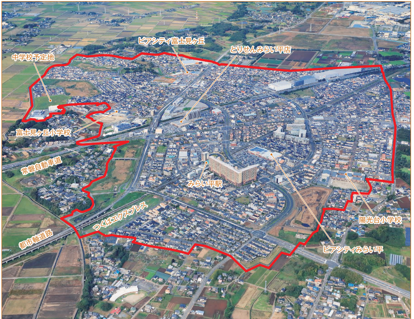
航空写真(令和6年10月撮影)

所在地:茨城県つくばみらい市 面積:約274.9ha 事業主体:茨城県 計画人口:約16,000人 現在人口:約17,500人(令和7年2月1日時点)